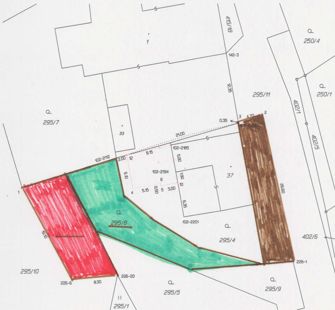
Seznam souřadnic (S-JTSK) Číslo bodu Souřadnice pro zápis do KN Y X Kód kv. Poznámka